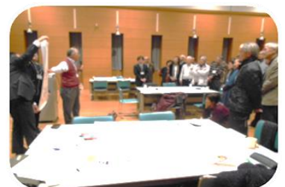
過去の講座の様子